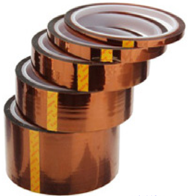
فیلم PET 5 متر